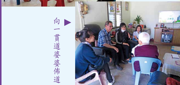
向一貫道婆婆佈道