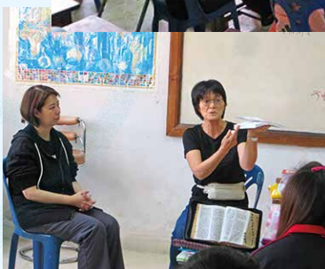
▲ 三福隊長堂上示範